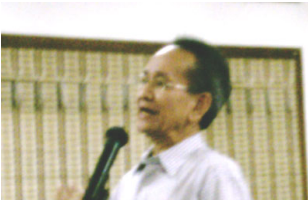
LVT gives his response.