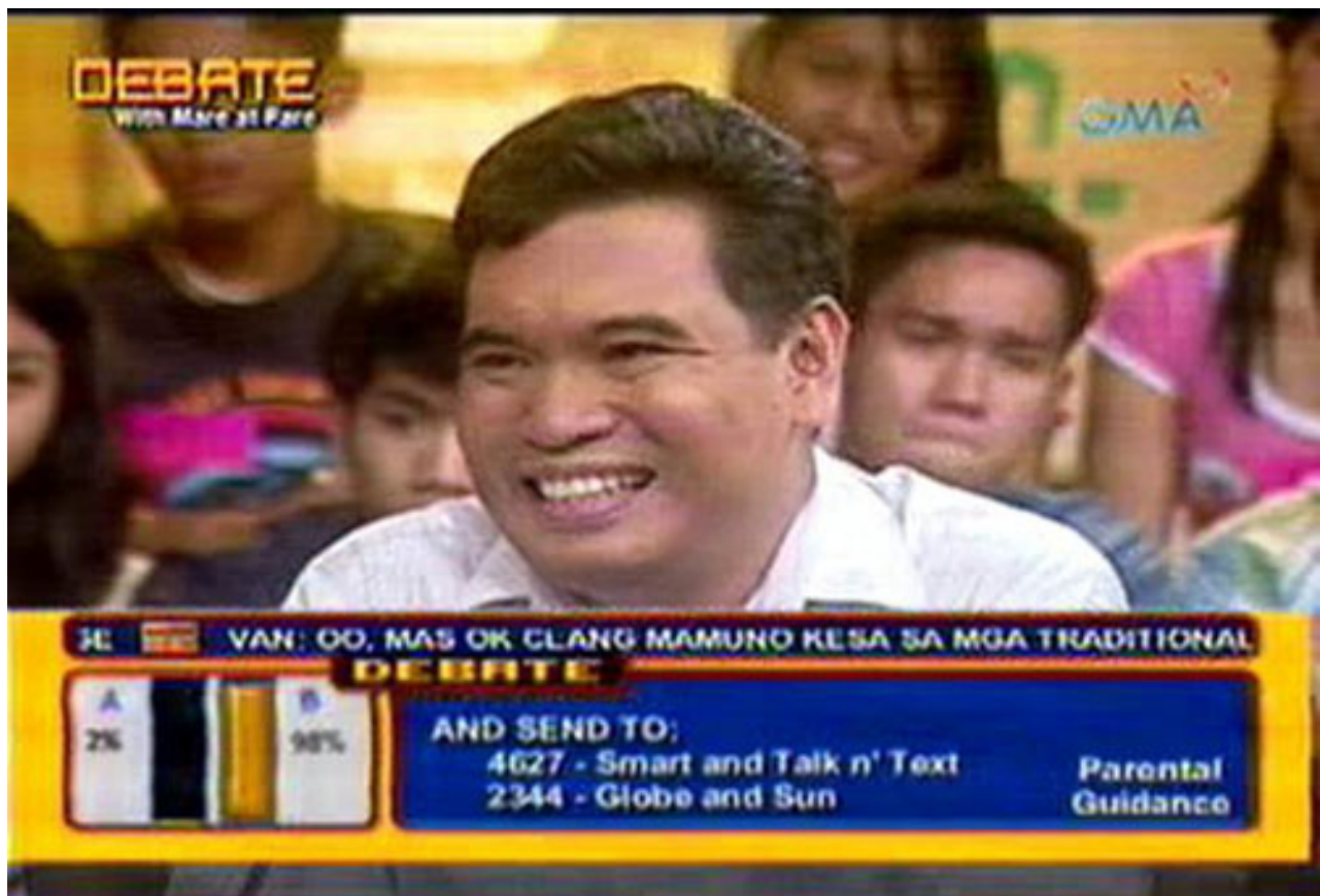
Thought balloon: "Say something intelligent and smile while doing so!"